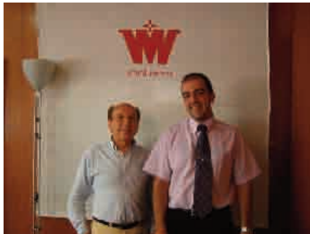
Group VMV- Salerm de Lliça de Vall

Mitjançant aquestes relacions amb les empreses, per una banda fem possible la realització de pràctiques de perfeccionament d'aquelles persones que estan realitzant diferents cursos de formació i, per una altra