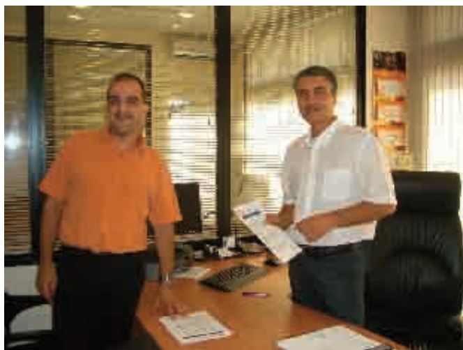
Multiboxes S.L. de Granollers

l'oferiment de la gestió d'ofertes amb la preselecció i presentació de candidats de diferents perfils professionals i laborals així com la informació dels diferents tipus de contractació en funció del col·lectiu.