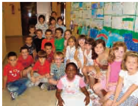
Alumnes 2n Primària

Des d'aquesta pàgina del Crit els nens i nenes de 2n us volem saludar i desitjar-vos un bon curs. Cada mes ens anirem veient i us anirem explicant tot el que fem. Fins aviat!!