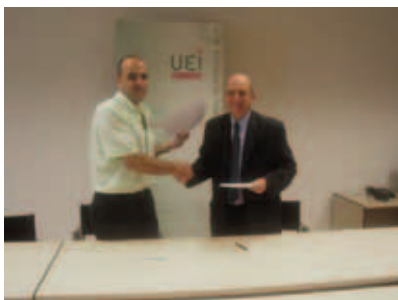
Signatura conveni U.I.E.-C.E. (Unió Empresarial Intersectorial-Cercle d'Empresaris) i Escola Pia Granollers

En aquest període s'han visitat més de 30 empreses informant de la possibilitat de utilitzar la nostra borsa de treball, hem aconseguit gestionar unes 15 ofertes de treball, inserint fins al moment 10 persones. També s'han signat dos convenis de col·laboració per a facilitar la inserció de persones amb més dificultat en la incorporació laboral, una empresa i una agrupació empresarial, totes dues molt arrelades a la ciutat de Granollers i a la comarca.