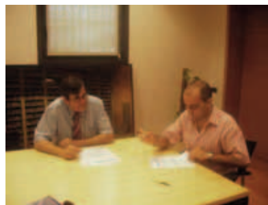
Signatura conveni Estabanell i Pahisa i Escola Pia Granollers