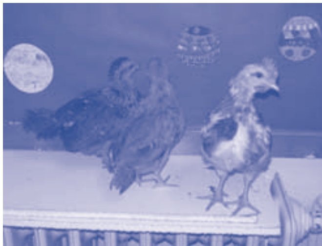
Clara Mejías 5è Primària D

A la fotografia podeu veure com han crescut: són dues gallines i un gall.